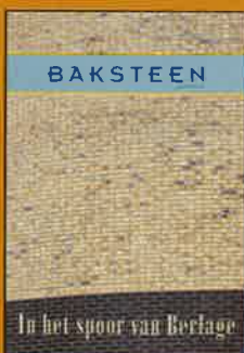
Meerhuizerplein, Amsterdam (Liesbeth van der Pol)

Baksteen is het vakblad van het Koninklijk Verbond van Nederlandse Baksteenfabrikanten (KNB) en verschijnt in controlled distribution drie maal per jaar. Het blad biedt informa- tie over de baksteenindustrie en belicht trends in en opvattingen over baksteen en architectuur. Het wordt toegezonden aan architecten(bureaus) en stedenbouwkundigen, tuin- en landschapsarchitecten, opdrachtgevers in de bouw, ONRI-leden, centrale en lagere overheidsinstellingen, aan- nemers (BouwNed- en AVM-leden), HIBIN-leden, onderwijsinstellingen en researchinstituten, (vak)pers en relaties van KNB. Copyright © 2003 KNB. Het overnemen van artikelen als bedoeld in artikel 15 van de Auteurswet is niet toegestaan.