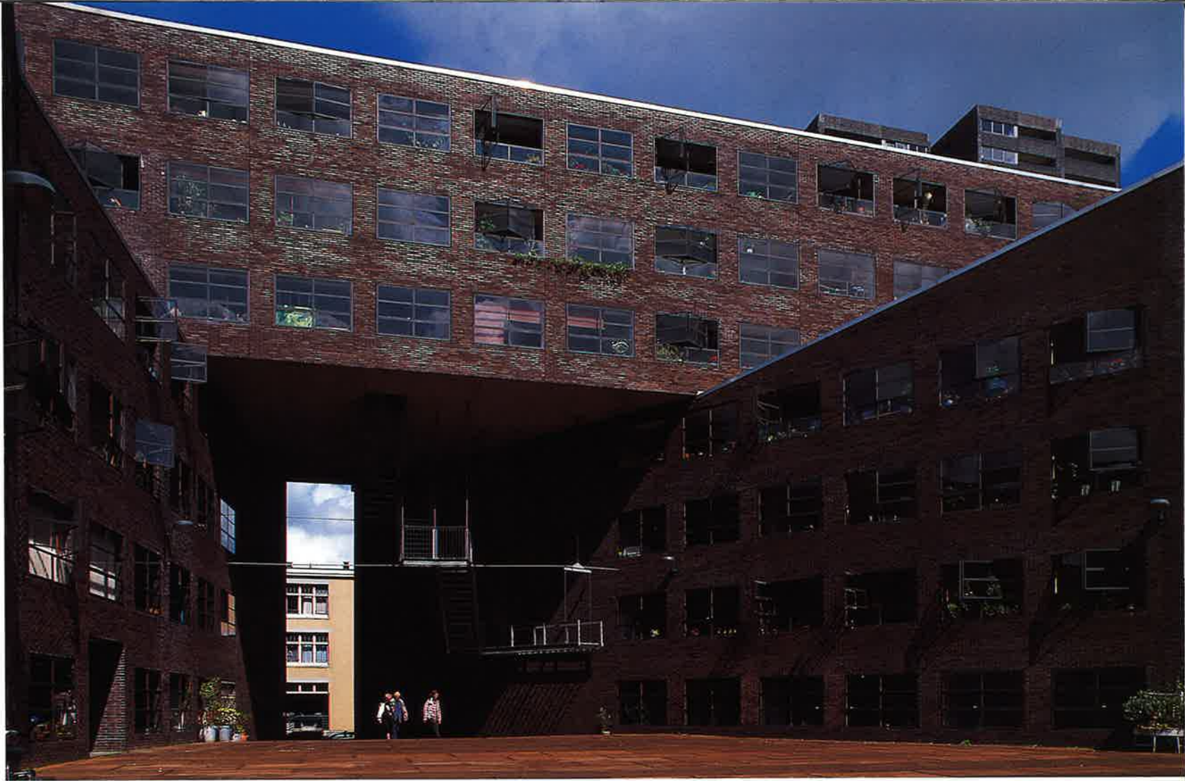
Piraeus, Amsterdam (H. Kollhoff, C. Rapp)

mens zijn door het modernisme van hun voetstuk gehaald en virtueel gesloopt – want uiteindelijk heeft Berlage dergelijke ‘paleizen’ nimmer kunnen voltooien, de Beurs uitgezonderd. Dat was, méér nog dan een ontmoetingscentrum van de financiële wereld, bedoeld als ‘palazzo publico’, een forum voor het volk. En daarin tekende zich al in miniatuur zijn stedenbouwkundige visie af. Want hoe is de goederenzaal anders te beschouwen dan als een groot atrium, een binnenhof omringd door gaanderijen met kantoren daarachter, voorbode van het gesloten bouwblok dat hij tien jaar later zou uitwerken voor Amsterdam-Zuid.