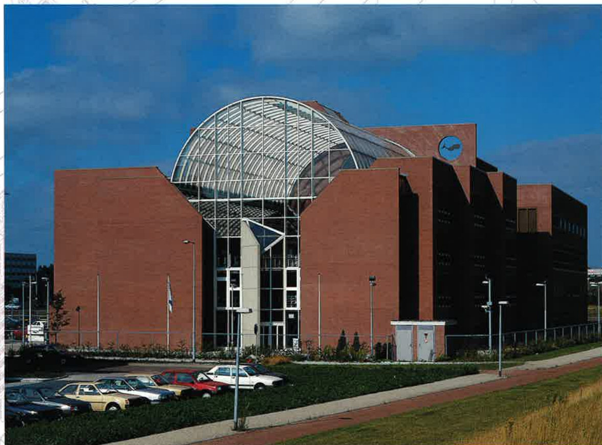
EuroCetus, Amsterdam (D. Benini)

De openlucht is voor de mediterrane Nederlanders vertrouwder dan de binnenkant van onze samenleving. In dat opzicht functione-