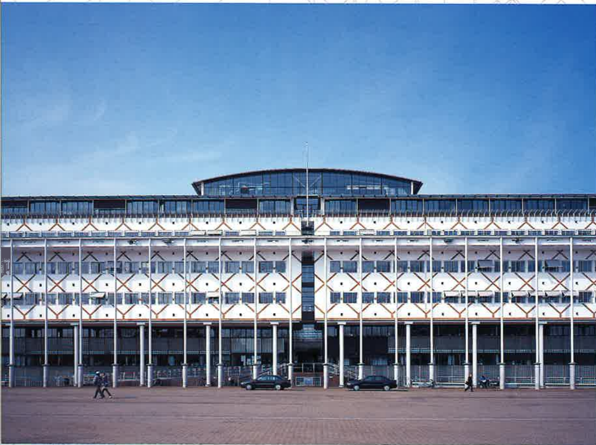
Stadhuis Apeldoorn (H. Ruijsenaars)