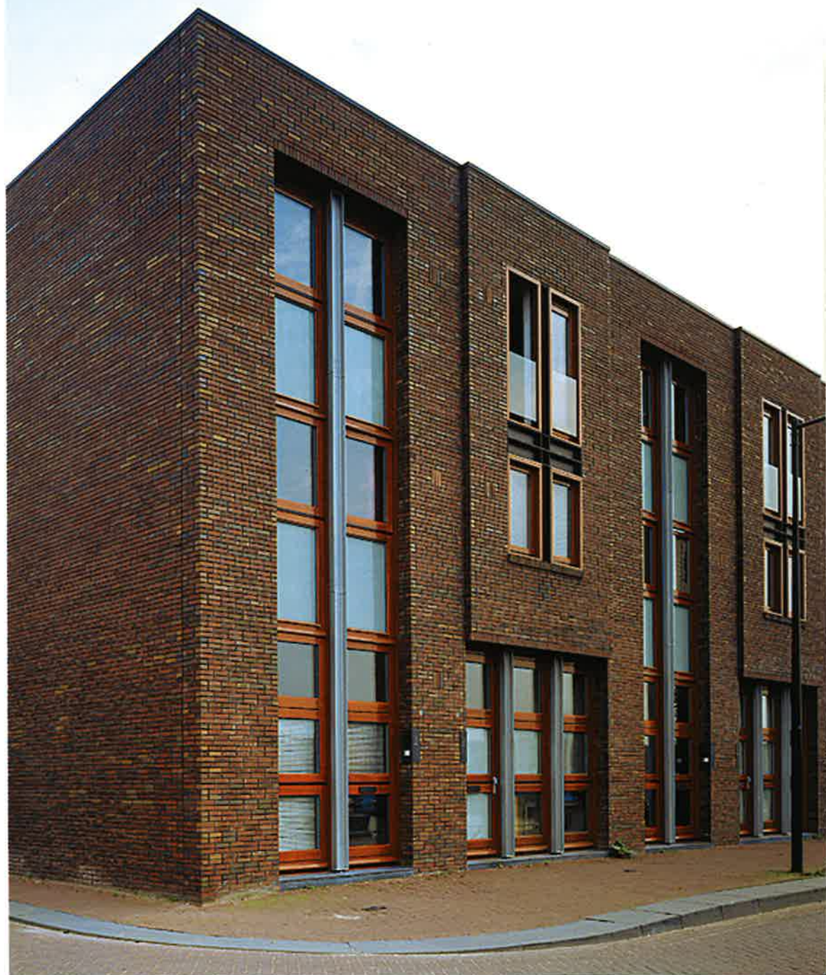
Borneo-eiland, Amsterdam (Architectenbureau Marlies Rohmer Amsterdam)

Berlage wel of niet als Grote Roerganger, dat is de vraag in het jaar dat de Beurs van Berlage honderd jaar bestaat. Het is in feite een gewetensvraag omdat er zich tussen hem en Koolhaas het alles overheersende modernisme heeft genesteld. De stroming die brak met de hiërarchie van Berlage, met het gesloten bouwblok en het plastische metselwerk. Uit de domi-