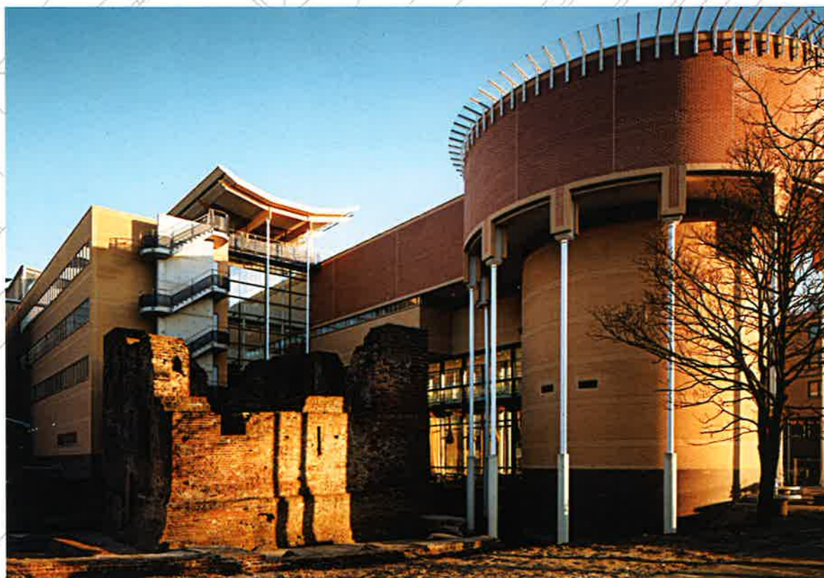
Stadserf Schiedam (H. Ruijsenaars)