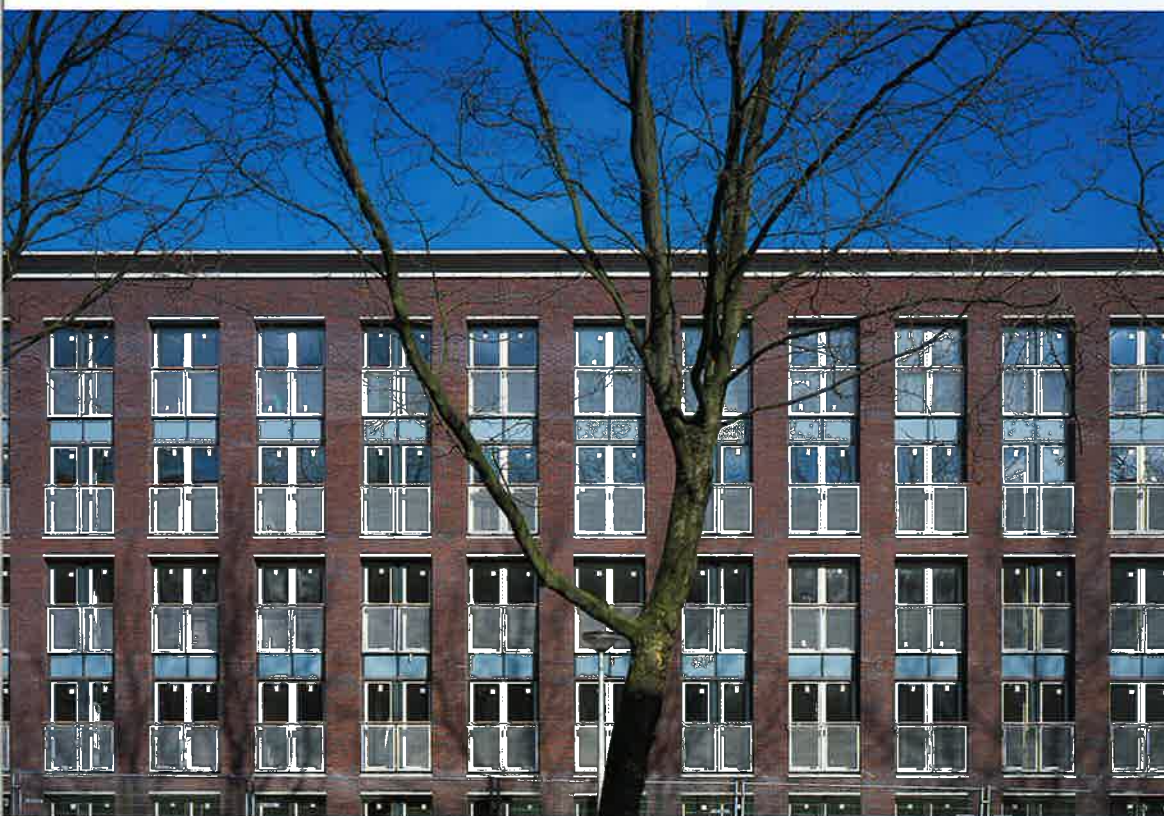
De Erasmus, Amsterdam (P. Defesche)

We zijn, met andere woorden, bevrijd van Berlage, hetgeen een fris, opgewekt gevoel zou kunnen opleveren, als we ons niet tegelijk enigszins verweesd zouden voelen. Stuurloze consumenten in vrije, gediversificeerde wijken. Als iets voorbij is, vult Defesche aan, is het dat idealistische wereldbeeld van Berlage, dat hij sublimeerde in getekende paleizen voor het volk en in zijn gedweep met de theosofie. Zijn bedachte monumenten ter verheffing van de